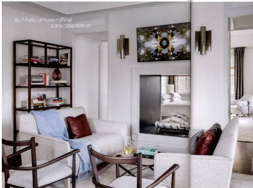
Au Mark, un luxe raffiné sans ostentation

Suite en blanc. Une des chambres avec son mobilier d'art de l'extérieur d'une cheminée à double face. Table basse "Hallow" en croisé de bois de l'ère (Bentley Home), poignées "Solène" en laiton et "Heringway" en acier et vernis transparent (Pier & Cose). Au premier plan, fauteuil en bois "Agnès" (Thousand Coast).